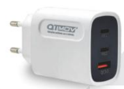
Fonte Externa Turbo

Carregador de Parede ABNT 14136 Suporte: Quick Charger 3,0 + Power Delivery, Entrada: AC 100-240V 50/60Hz Saída: DC, Porta USB Tipo A: 5V/3A, 9V/2A, 12V/1,5A Porta USB Tipo C: 5V/3A, 9V/3A/12V/2A, 15V/3A, 20V/2,25A Fabricação: Termoplástico fornecido na cor branco.