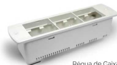
Régua de Caixa Série 210 (Compatível c/ caixa Passa Cabos)