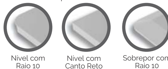
Tipos de Colarinhos